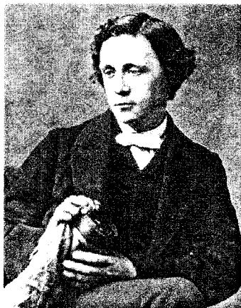
A sinistra, Lewis Carroll e un'illustrazione del suo capolavoro «Alice nel paese delle meraviglie». Sotto, alcune copertine di audiolibri